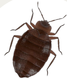
Aikuinen lude on ruskea ja noin 4-8 mm pitkä.